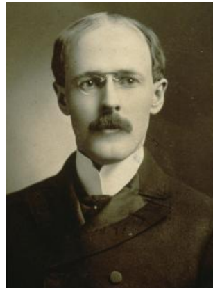
ポール・ハリス氏